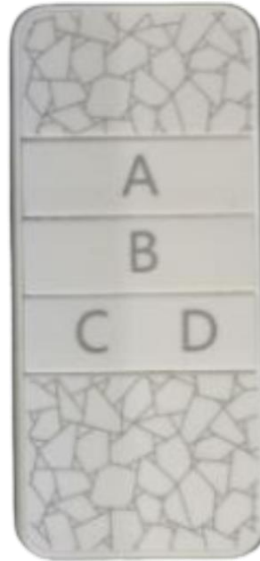
شکل 2: ریموت دستگاه

✓ با استفاده از ریموت تغییرات تایم 0/001 است.